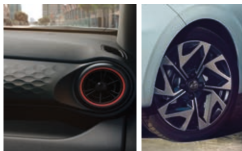
Detalles interiores en rojo/negro y llantas exclusivas en 16 pulgadas.

El volante N Line combina comodidad y control con la elegancia del cuero perforado. Al igual que el pomo y los pedales metálicos.