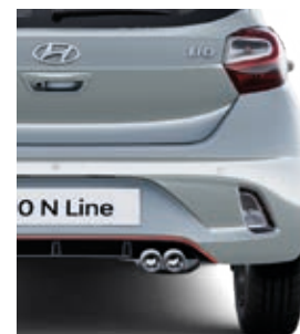
Salidas de escape deportivas.

Detalles rojos en volante, palanca de cambios, aireadores y asientos.