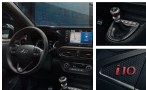
Volante, pomo de cambio de marchas y pedales N Line.

El volante N Line combina comodidad y control con la elegancia del cuero perforado. Al igual que el pomo y los pedales metálicos.