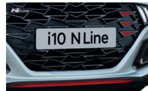
Parrilla delantera exclusiva N Line.

La esencia de carreras también se refleja en la parte trasera, con la doble salida de escape, bajo un pequeño difusor trasero. Las luces traseras son tipo LED.